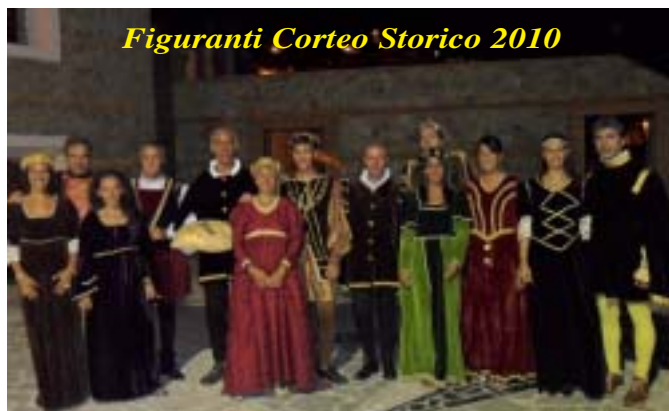
Figuranti Corteo Storico 2010

«CERCHIARA DI CALABRIA PERLA DELLO JONIO»